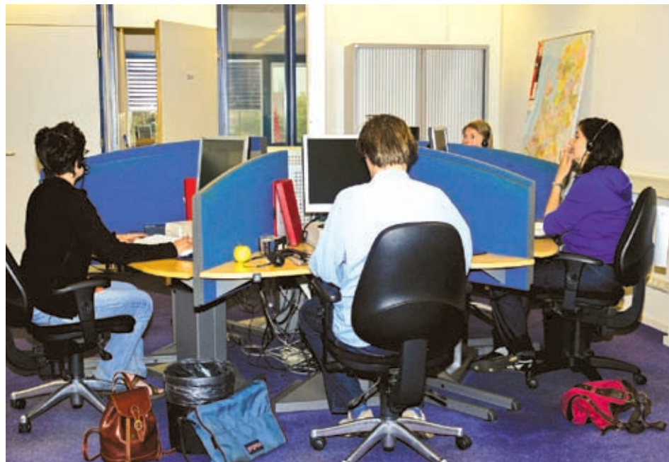
Antwoordservice werkt achter de schermen voor de opdrachtgever

in een oogwenk van welk pand welke technisch beheerder, eigenaar, aannemer of onderhoudspartij op welk tijdstip direct op de hoogte moet worden gebracht. Bovendien worden alle storingen nauwkeurig vastgelegd, eventueel direct in het backofficesysteem van de opdrachtgever, en direct per e-mail naar de manager verzonden. Zo blijft het bedrijf altijd op de hoogte van de status van de gemelde storingen en weet hij ook precies wie uiteindelijk de storing heeft opgelost.