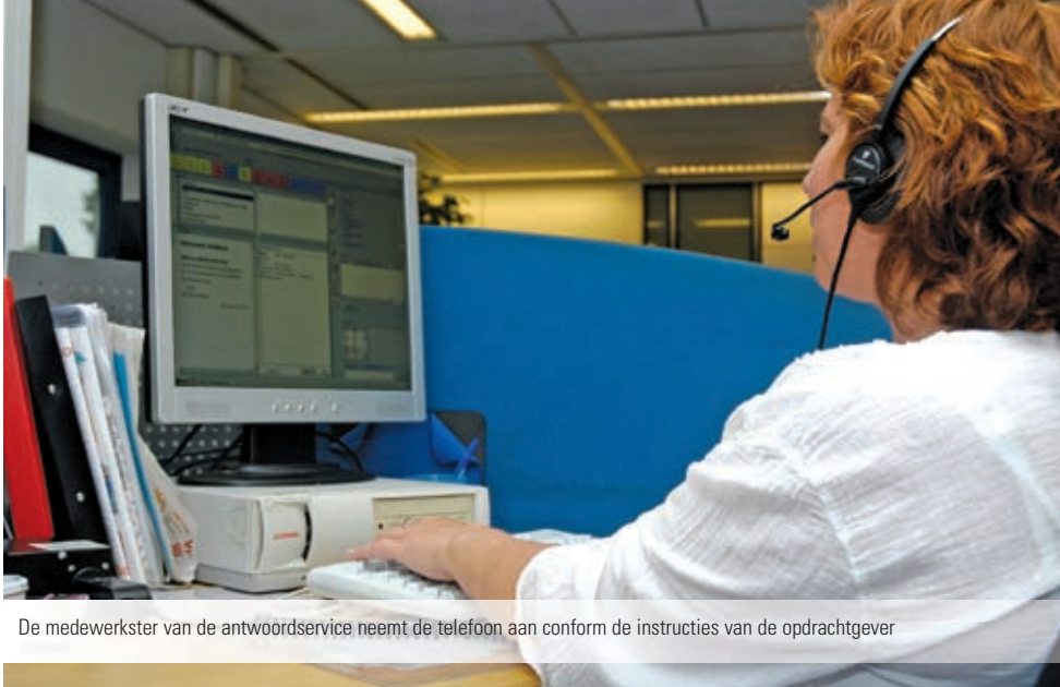
De medewerkster van de antwoordservice neemt de telefoon aan conform de instructies van de opdrachtgever