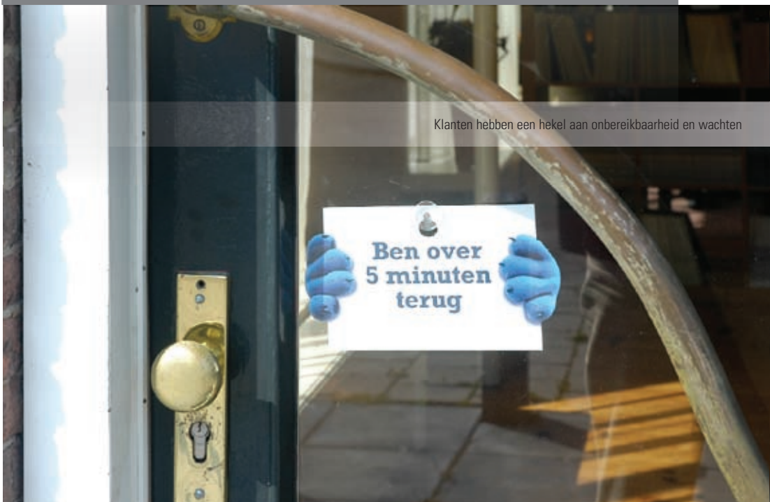
Klanten hebben een hekel aan onbereikbaarheid en wachten

Een goede telefonische bereikbaarheid is belangrijk voor bedrijven en organisaties. Tegelijkertijd is het voor hun medewerkers onmogelijk en ook onwenselijk om altijd bereikbaar te zijn. Om dit alles in goede banen te leiden, zijn er antwoordservicebedrijven, in opkomst sinds de jaren tachtig.